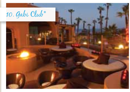
10. Gabi Club®

Großer Süßwasserpool, Restaurant und Poolbar.