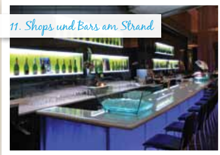
11. Shops und Bars am Strand

Eine Auswahl an Geschäften und eine Reihe von Bars, darunter auch die prachvolle Champagner-Bar.