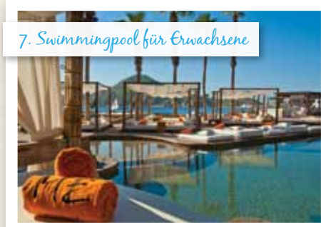
7. Swimmingpool für Erwachsene

Großer Pool, separate Pools für Kinder und Babys, ein Restaurant und eine Poolbar.