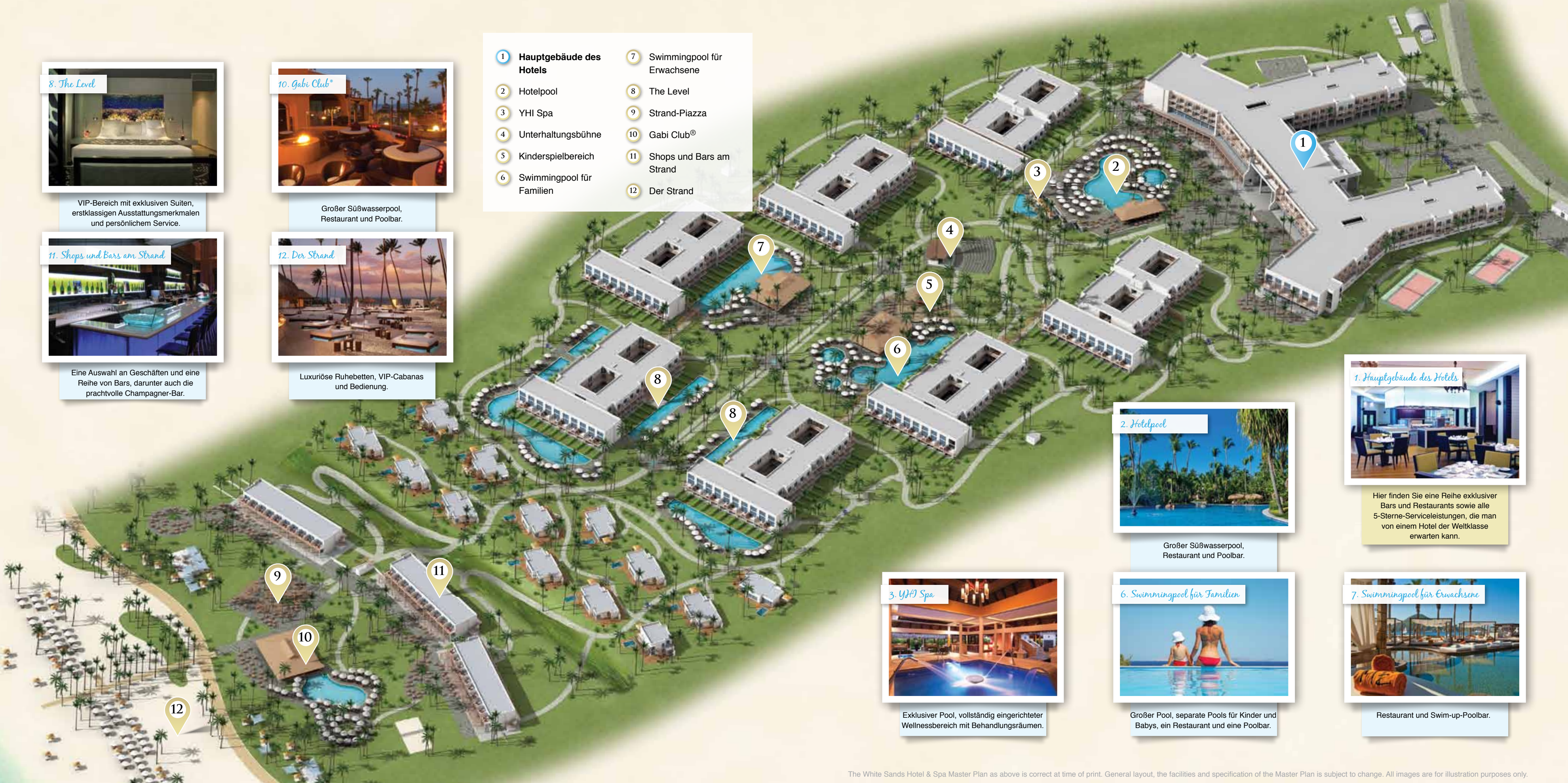
1. Hauptgebäude des Hotels

Luxuriöse Ruhebetten, VIP-Cabanas und Bedienung.