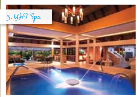
3. YHI Spa

Exklusiver Pool, vollständig eingerichteter Wellnessbereich mit Behandlungsräumen.