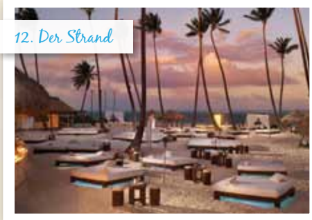
12. Der Strand

Luxuriöse Ruhebetten, VIP-Cabanas und Bedienung.