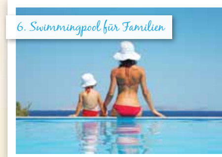
6. Swimmingpool für Familien

Großer Pool, separate Pools für Kinder und Babys, ein Restaurant und eine Poolbar.