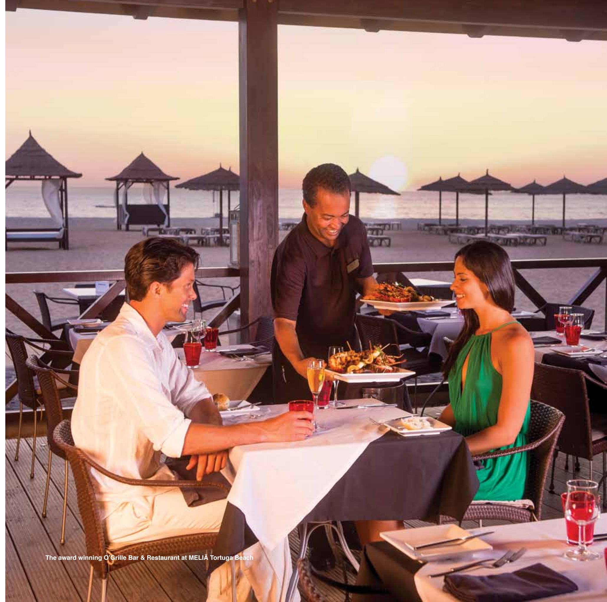
The award winning O'Grille Bar & Restaurant at MELIÁ Tortuga Beach

The Resort Group beabsichtigt nun, ihr erfolgreiches Entwicklungsmodell auch auf Boa Vista anzuwenden – eine Strategie, mit der wir dafür sorgen, dass Immobilieneigentümer weiterhin von langfristigem Wachstumspotenzial und konstanten Mieterträgen profitieren werden.